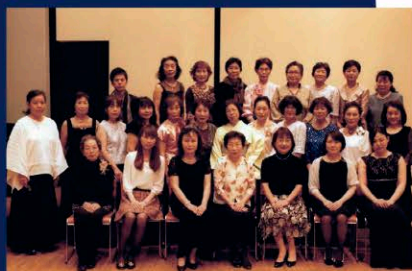
第4回のコンサートにて

第6回鞠の会 冬のコンサート ～世界名歌曲の調べ～ 日時: 12月2日(日) 13時半～ 会場: 門川町総合文化会館 入場無料 問合せ: 鞠の会(峯) 090-7468-0467