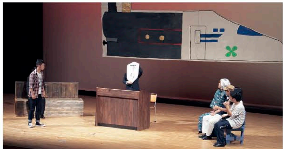
最優秀賞を受賞した3年2組

クラスが一丸となって取り組んだ演劇の思い出は、皆さんにとって忘れられない思い出になったと思います。