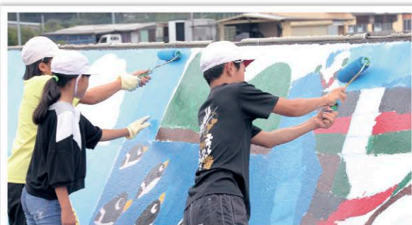
壁画を制作する6年生児童

テーマは「いつまでも大切にしたいわたしたちのふるさとかがわ」で、児童たちは門川町の景色や祭りのだんじり、マスコットキャラクターがどっぴりなどをクラスで協力して防波堤に描きました。