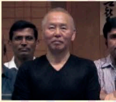
JICA外国人研修講座「江戸東京のインフラ整備」の講師として研修生と(江戸東京博物館にて)