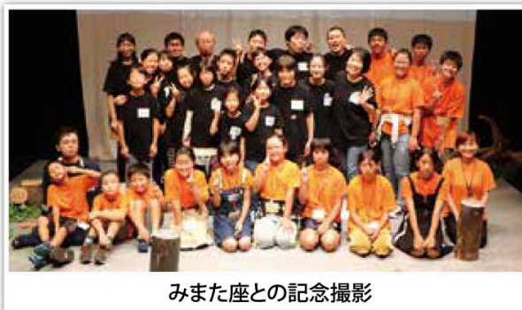
みまた座との記念撮影

9月22日と23日の2日間、演劇講座「かどがわ演劇の広場」の発表公演を行いました。今回は昨年上演した作品「むこうの海へ」をリメイクして再演、地元門川海浜総合公園で起こった不思議なお話を大人を含めた受講生ら18名が演じました。6月にスタートしたこの講座、初めて舞台に立つ小学生もいましたが、本番では見守る家族の前で堂々とした演技を披露していました。また今年も三股町から「みまた座」の子供達13名が鑑賞に訪れ、演じた子供達と交流を深めました。