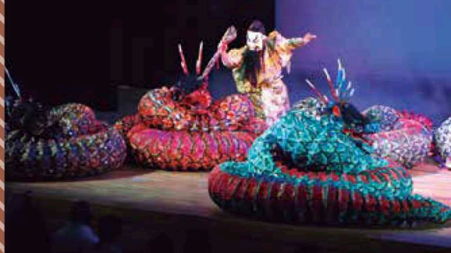
石見神楽「大蛇(オロチ)」の一コマ

石見神楽は、謡曲を神能化した出雲の「佐蛇神能」が石見地方に伝わり、民衆の娯楽として演劇化されてきたもので、日本神話におけるスサノオの八岐大蛇退治を題材とした「大蛇」は舞台狭しと八体の巨大な蛇が動き回る迫力の演出で、初めて観た人の中にはあまりの迫力に感動して涙する人もいました。