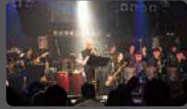
フェニックス JAZZ 楽団