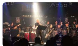
フェニックス JAZZ 楽団