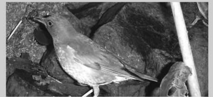
文: 中村 豊 (門川町文化財保護審議委員)

枇榔島に生息する鳥 21; シロハラ。以前紹介したアカハラと同じツグミの仲間ですが、この鳥は冬鳥として島の林内でよく見られます。アカハラとほぼ同じ体重、体長をしていますが、こちらは雄雌ほぼ同色で、背中と翼の上面はオリーブ褐色で、胸から腹部にかけてはくすんだ白色で名前の由来となっています。尾羽は黒褐色で、両外側先端に白く目立つ白斑があり、飛び立つと目につくのですぐに識別ができます。地上生の昆虫やミミズなどを取るため林内の地上で、落ち葉をかき分けてエサを探していますが、アカハラよりも落ち葉かきが少し激しく感じます。冬は木の実もよく食べるので住宅の庭に植えられたクロガネモチやピラカンサの実を食べに来ているのを良く見ます。