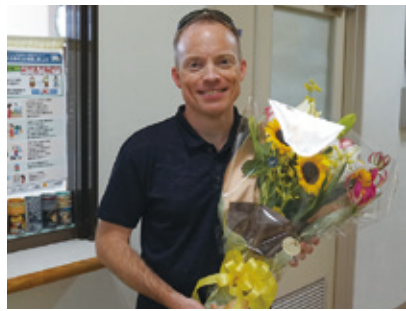
門川町での演奏を最後に退役されるジャーマイア・トゥルー曹長