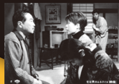
「喜劇 女は男のふるさとヨ」

主催: (公財)門川ふるさと文化財団 / 国立映画アーカイブ 特別協力: 文化庁 / (社)日本映画製作者連盟 / 全国興行生活衛生同業組合連合会