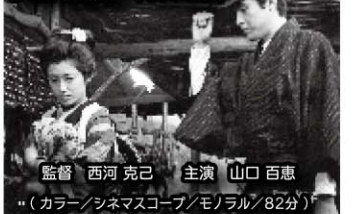
監督 西河 克己 主演 山口百恵 (カラー/シネマスコープ/モノラル/82分)