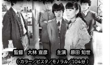
監督 大林 宣彦 主演 原田 知世 (カラー/ビスタ/モノラル/104分)