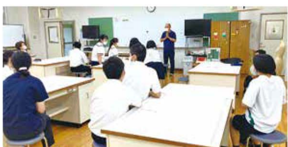
演劇講座を受講する門川高校3年生

これから本番に向けて配役や演出、裏方の担当者を決めて取り組みますが、まずはそれぞれのクラスの特徴を生かした戯曲を書き上げます。 今年は何んな作品ができるかとても楽しみです。