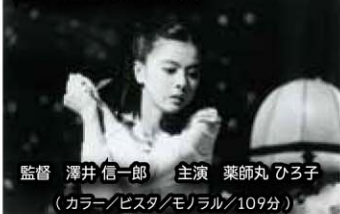
監督 澤井 信一郎 主演 薬師丸 ひろ子 (カラー/ビスタ/モノラル/109分)