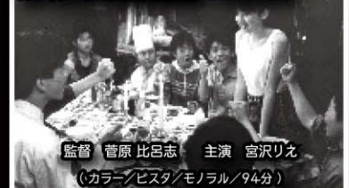
監督 菅原 比呂志 主演 宮沢リエ (カラー/ビスタ/モノラル/94分)