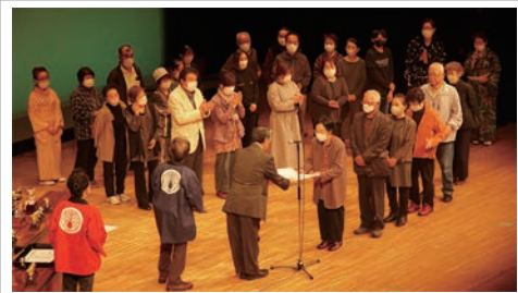
受賞された方々、おめでとうございます！

本大会では、牧水杯の部や門川町長杯の部など、様々な部門で審査員による採点が行われ、得点が高かった方には賞状とトロフィーが授与されます。 出場者は老若男女問わず、こぶしの効いた歌い方や力強い声色など、多種多様な歌声が大ホールに響き渡り、また歌の合間には舞踊も披露され大会に華を添えました。 大会最後には各部門の入賞者が発表され、その後表彰式が行われました。 門川ふるさと文化財団はこれからも、伝統芸能・文化活動を続けられる皆様を支援すると共に、より多く