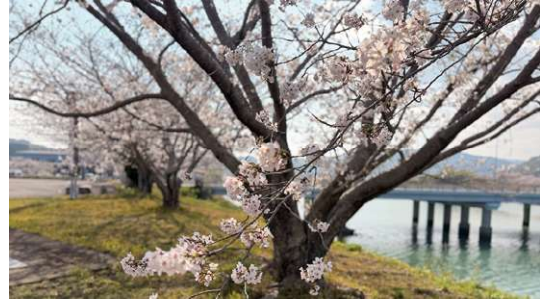
文・写真：吉田将大

連載中の「門川ミニお魚図鑑」が村瀬先生のお仕事の都合により、しばらく休載となります。連載が再開するまで職員の独り言コラム(笑)にお付き合い頂けますと幸いです。さて、毎年春になると、敷地内の堤防に立派な桜が咲きます。国道10号線(いすず橋)を日向/宮崎方面に向かう際に、よく見えます。満開の時期になると、利用者の皆様が足を止めて桜を見てくださり、事務所の窓からその後ろ姿を確認して、ようやく春が来たと感じるのです。また、街灯に照らされる夜桜も大変美しく、足を止めて眺めていると、体育室を利用する皆様の声が聞こえてきます。今年も、短い桜の季節が終わりました。